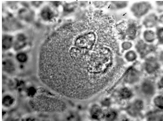
Fig. 1 - Megacariocita in mezzo addizionato di MLT

L'affermazione oltre che postulare per la MLT un nuovo eventuale ruolo fisiologico nella piastrinogenesi, contribuisce ad orientare verso altri "targets" la sua azione fisiologica.